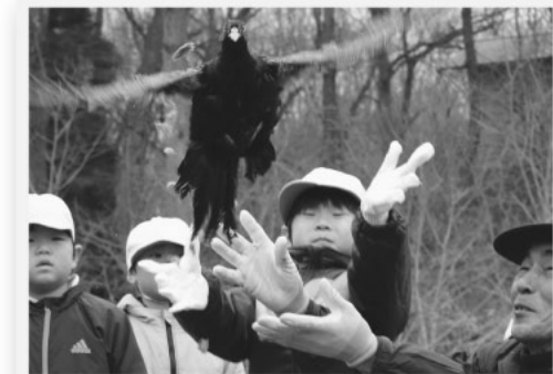
それっ！力強い羽ばたきに、思わず目をつむってしまいます

キジの放鳥 3/4金 県内80カ所ある県指定の鳥獣保護区の1つに指定されている来島ダム湖周辺で、出雲市斐川町で育てられたニホンキジを放鳥しました。 この日は、頓原小学校の約20人の子どもたちと猟友会の皆さんの手から、雄・雌あわせて50羽のキジが飛び立ちました。子どもたちは、初めは少し怖がりながらも、普段見ることのないキジに触れて、体の温かさを感じているようでした。 この取組みは、キジの自然界での繁殖の促進や生息数の増加を目的として行われています。