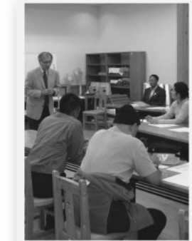
町の産業を盛り上げるために必要な基礎知識を取り入れます

イノベーション 人材育成セミナーを開催しました 「人材育成」を通じて「企業の利益」を上げることと定評のある「産業能率大学」と連携して、地元企業を対象とした人材育成セミナーを開催しました。 「飯南町に人が来るためにはどうするか」をテーマに、計5回(17年10月~18年2月)開催し、町内から8社の企業が参加しました。 主な研修内容 「モノを売る発想」から「コトを売る発想」 アイデアを発見する技術 正しい「ニーズ」の認識 平成28年度以降は、「参加する企業にとつてのイノベーションを考える」をテーマに実践型の研修を計画しています。多くの企業の皆さんの参加をお待ちしています。 ■お問い合わせ/産業振興課 新産業担当 電話 76・2214