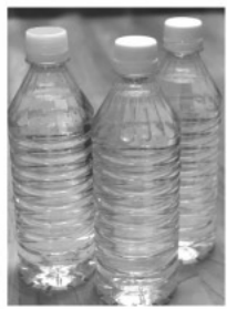
体重50kgの人であればこれくらいが目安です(1日500mlペットボトル3本)

今年も残りわずか。忘年会などでアルコールを摂取する機会も増えていますが、水分補給にはなっていません。意識的に水分を摂って、元気に良い年を迎えましょう！