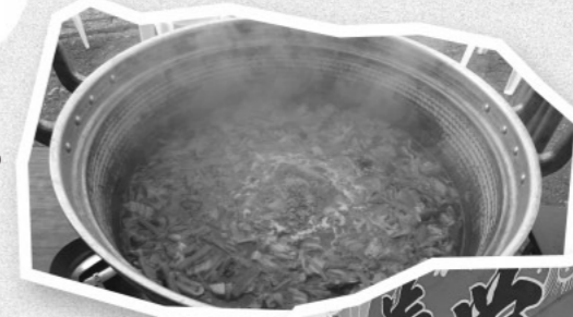
体の温まる一杯です(猪汁)

●青空市ぶなの里 〒690-3206 飯南町花栗47-1(道の駅頓原併設) 電話(FAX) 72・1530 営業時間 11月～ 4月:8:00～17:00 5月～10月:8:00～17:30 定休日 毎月第三木曜日 (年内は12月29日まで営業・年始は1月8日から営業) 毎週木曜日:お米の日 毎週金曜日:百円市 Facebookページ/ http://www.facebook.com/aozoraichi.bunanosato