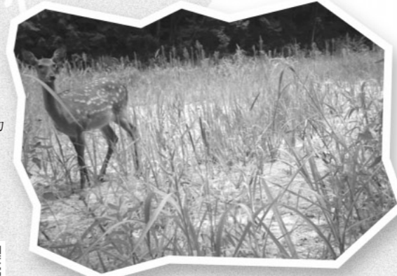
町内で確認したメスジカ (自動撮影カメラ)

●中山間地域研究センター 電話0854・76・2025 http://www.pref.shimane.lg.jp/chusankan/