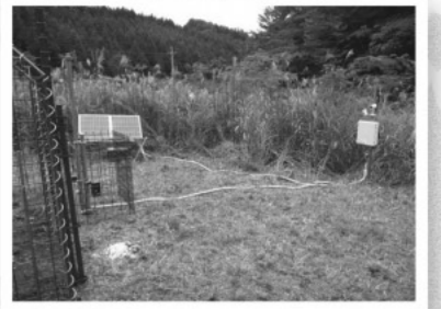
Webカメラを装備した捕獲装置

飯南町では、広島県側から拡がってきたニホンジカによる、農林作物への被害が懸念されています。当センターでは、猟友会や役場などと共同で、スマートフォンと遠隔操作が可能な捕獲装置を組み合わせた効率的な捕獲実証試験を始めました。今後、捕獲者への技術移転を進めていく予定です。