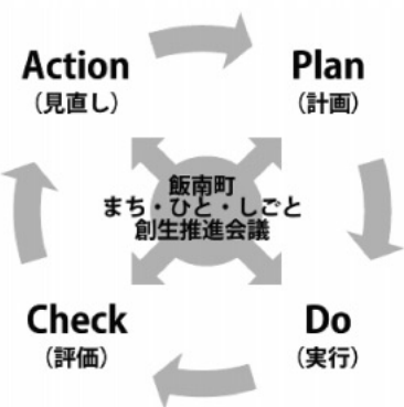
毎年度、施策効果を検証し改善策を検討します。

●女性が自分らしく輝くまちを目指す 女性がいきいきと自分らしく飯南町での生活を楽しめるようなまちを目指します。