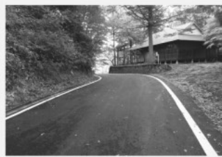
舗装工事を行った町道恵比線

電源立地地域対策交付金は、水力発電などの発電施設がある市町村等に対し、地域振興のために交付されるもので、飯南町では来島ダム(潮発電所)が該当します。