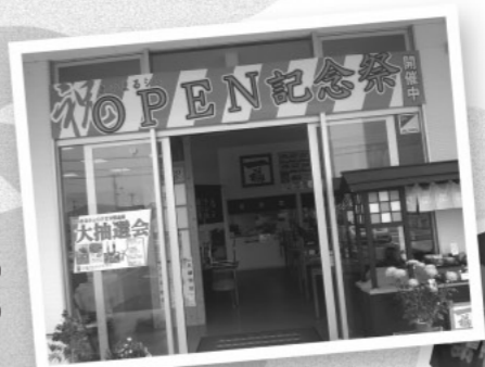
ぶなの里での隠岐の島コーナーの様子

■出荷についてのお問い合わせ JAしまね飯南営農経済センター 電話76・2967