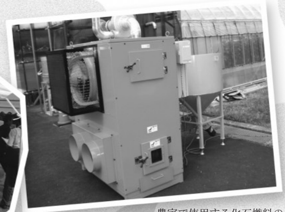
農家で使用する化石燃料の高騰対策として期待！