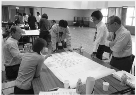
6月4日「合同会議」でのワークショップ

推進会議は、5月12日に第1回会議を、6月4日には総合振興計画策定委員会との合同会議を開催しました。