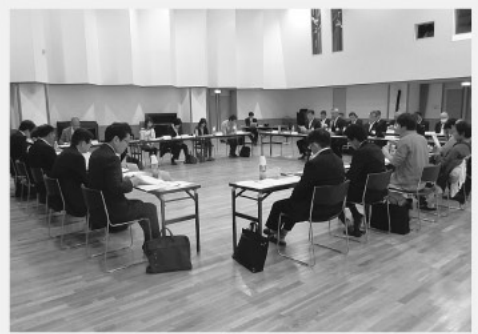
5月12日 第1回「飯南町まち・ひと・しごと創生推進会議」