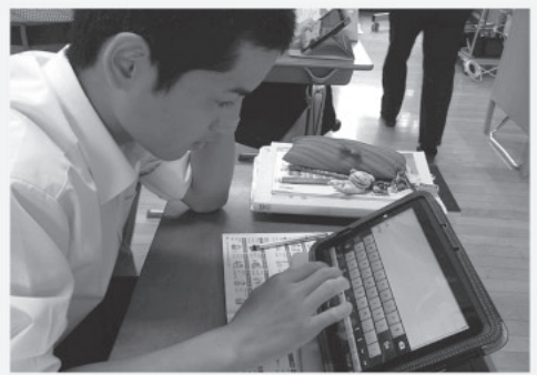
町内小中学校のタブレットパソコンを購入しました

社会保障・税番号制度ホームページ http://www.cas.go.jp/jp/seisaku/bangoseido/