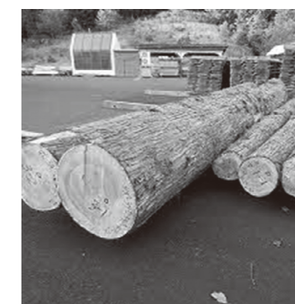
コウヨウザンの原木