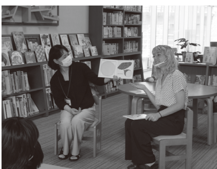
6月のおはなし会の様子