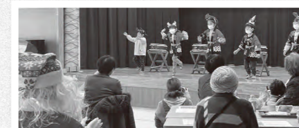
2022年12月の「陽サロ2号店」より

住民ボランティア、保育所、小学校、保健師、駐在所、頓原中職場体験生徒など、多くの皆さんと手を繋ぎ運営しています。