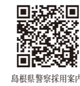
島根県警察採用案内

誰かの役に立ちたい、島根県で働きたい方は、ぜひご応募ください。 ※試験詳細は島根県警察HPでご確認ください。 ☎問合せ 雲南警察署総務課 45-0110