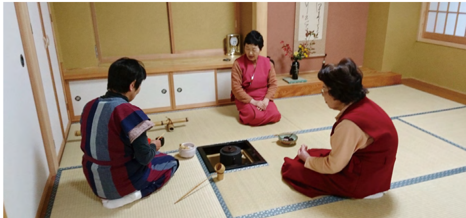
月1回「放課後子ども教室」の児童への指導も行っています

正座でのお手前だけでなく、椅子に座って行う立礼式でのお手前もできるので、足の悪い方でもお手前を披露することができます。茶道に興味のある若年層の方がおられましたら、ぜひご連絡ください。一緒に茶の道を楽しみましょう。