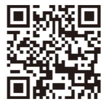
(一社)中国建設弘済会ホームページ