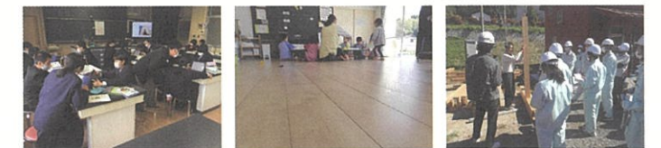
飯南高校魅力化推進のための取り組み | 保育所の床板張替 | 森林魅力化プロジェクト - 農林大学の研修 -