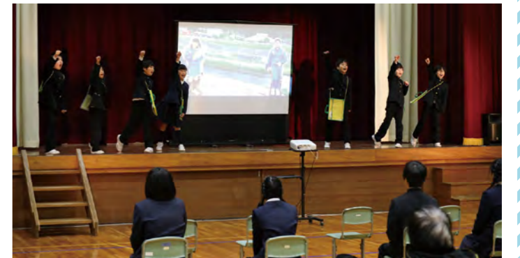
総合的な学習の時間での研究を発表(志々小)