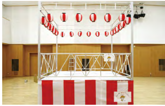
今後の自治振興に活用します(来島ビジョン推進会議)