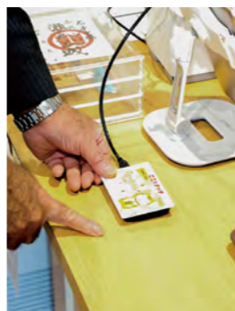
タッチするだけで簡単に決済

「いっしょにゃんPAY」は、町内消費で通貨の地域内循環の喚起、キャッシュレス時代への対応が目的。町内63事業者(11月末時点)で、カードでもスマートフォンアプリでも利用できます。現金チャージ機能を有し、買い物110円(税込)で1ポイントが付与。2月9日までの利用申込で、町から3千ポイント(3千円分)を付与します。年末年始のお買い物にもぜひご利用ください。