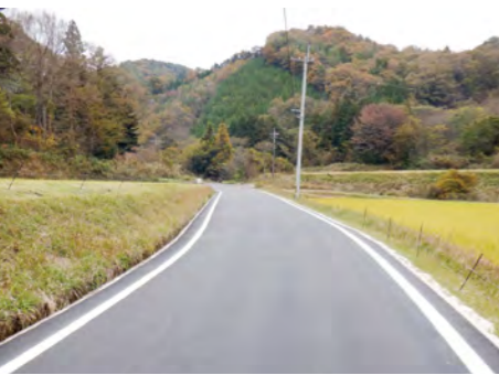
整備された長谷地区の道路

地域活動の活性化のため、宝くじ社会貢献広報事業の助成を受け、今年度は、来島ビジョン推進会議、杉戸自治会、上赤名自治振興協議会の3団体がエアコンをはじめとした備品を整備されました。 この事業は、(一財)自治総合センターが、地域のコミュニティ活動の充実・強化と地域社会の健全な発展、住民福祉の向上のため、宝くじの受託事業収入を財源として実施する事業です。