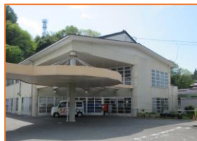
飯南町子育て支援センター 「ほっと。Café」