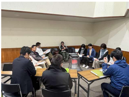
11/13@赤来校区保護者説明会