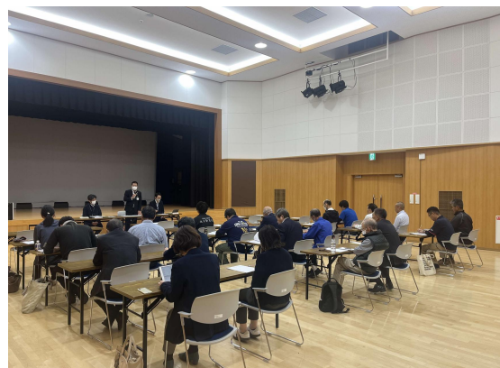
10/20@来島地区住民説明会