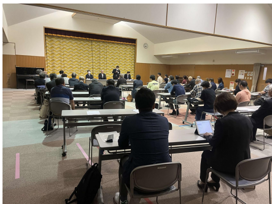
10/16@志々地区住民説明会

志々での説明会には町長も出席。これまでの経緯や今後「志々地区協議会」を設置し、統合に関することや地域振興を検討することを説明。皆様から了承されました。