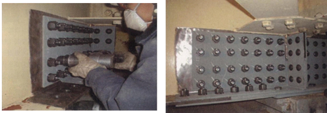
写真 5-1 当て板工実施状況

激しい腐食による鋼部材の減厚が生じた箇所に対し、腐食箇所を取り囲むようにあて板（添接版）を施すことにより鋼部材を補修する工法です。