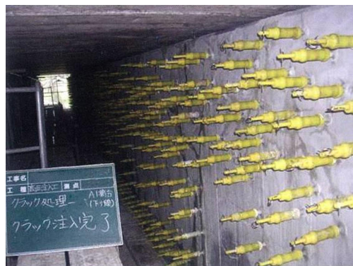
写真 5-2 ひび割れ注入状況

ひび割れを塞ぐことにより、劣化因子（水分、塩化物など）の侵入を防止し、コンクリートの耐久性を向上することができます。