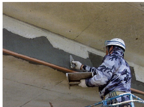
写真 5-3 断面修復状況