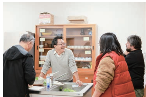
移住者や町民を集めて行う、月一のお話会「ごめたば」を始めて5年目。この日は鍋会。

行き「まで明るくなるように」という願いも込めています。あと、妻との想い出の「スノーキャンダル」のイベントからも「ゆきⅡ雪」と思い込んでいたら、予想外のトリプルミーニングだった。