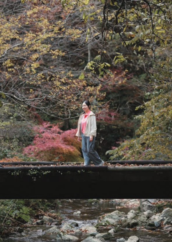
※「飯南町ふるさとの森 森林セラピー基地」は、森林浴による癒し効果が科学的に認められ、全国で2例目・西日本初の「二つ星」に認定されている。